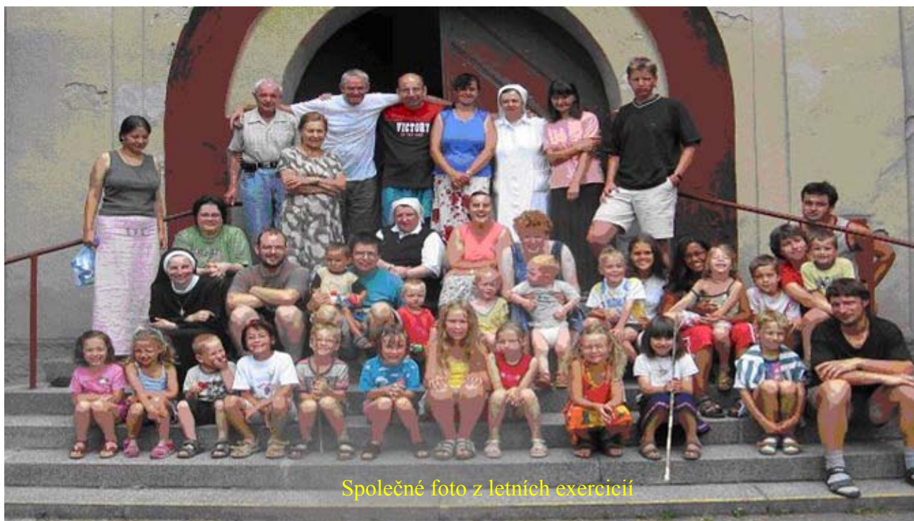
Společné foto z letních exercičí