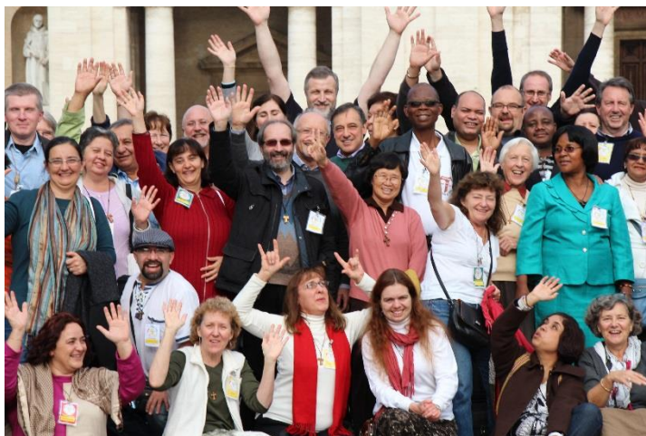
Delegáti Generální kapituly

dostat do Číny na vizitaci) a Haiti, kdy je stále mnoho práce na obnově země zničené zemětřesením.