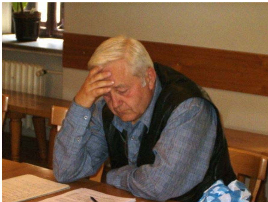
Legislativní činnost je zjevně náročná....

Hlavním úkolem roku 2005 je vydání základních právních dokumentů našeho řádu v posledním platném znění – řehole, generálních konstitucí a národních stanov. Budou zpracovány zásady spisové služby našeho národního bratrského společenství dle zákona o archivnictví a spisové službě a dle prováděcích předpisů. Nadále bude podle potřeby poskytována pomoc při jednotlivých postupech, úkonech a problémech v praktickém každodenním životě národního i místních bratrských společenství.