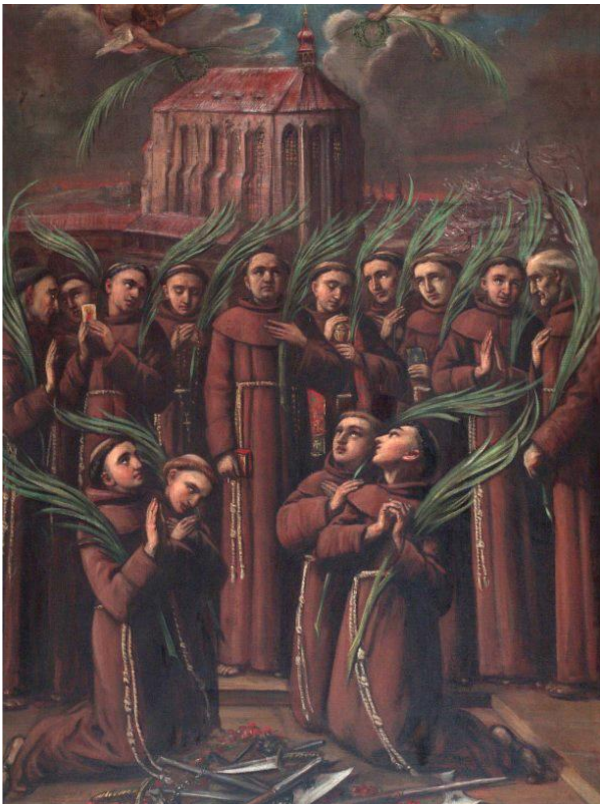
Bl. 14 františkánů umučených 15. 2. 1611 v klášteře u P. Marie Sněžné v Praze