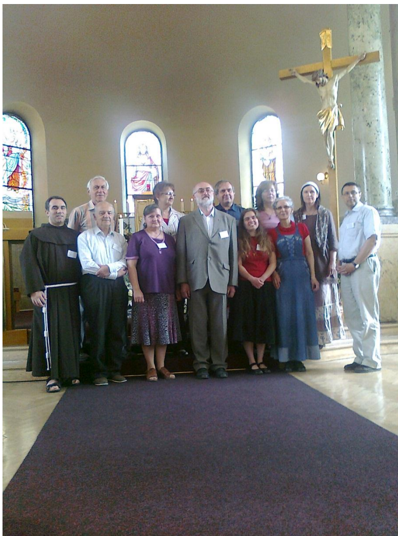
Nová Národní rada a mezinárodní dohled z obou stran