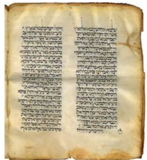
MS. 200 Hebrew square book script. Inq. 1st half of 11th c.

Ale podívejme se, jak daleko jsme od této reality! V našich vlastních rodných kulturách často žijeme v bratrských společenstvích se stejným nedostatkem respektu, jako žije naše společnost. Stále si zakládáme na našich titulech... na našem „zlatě“ (majetcích)... na naší kastě... na všech úrovních ve všech kulturách. A často pokračujeme v kastovní mentalitě v našich bratrských společenstvích, v našich konventech a kláštorech. To je špatně. To není cesta, po které je nám určeno kráčet. Náš cíl se nemůže vztahovat k moci. Tento cíl nemůže disponovat prostředky k organizaci za účelem opevnění mého