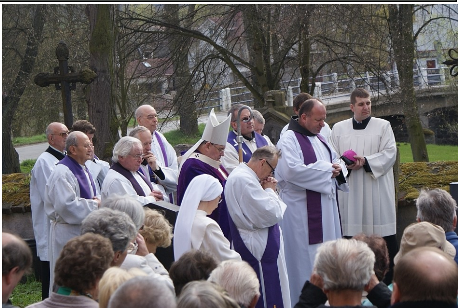
Z letošní pouti

Pracoval s takovým nasazením, že přepínal svoje síly a tak zemřel předčasně, ve věku 49 let. Letos byla za něho slavena mše svatá v Poříčí nad Sázavou v kostele sv. Havla – při němž je po-