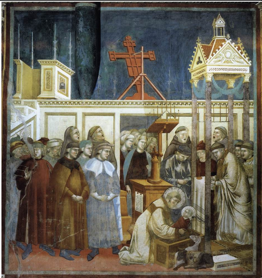
Giotto—Slavnost v Grecciu, freska z horního kostela sv. Františka v Assisi

„Fanoušek“. To byl můj táta a nápis vyvracel všechny bajky o zlých tchýních. Babička mého otce přímo zbožňovala a ten karton Partyzánek či Globusek, byť