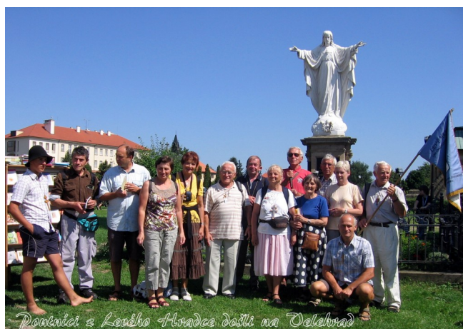
Poutníci z Leského Hrádku došli na Odehrad