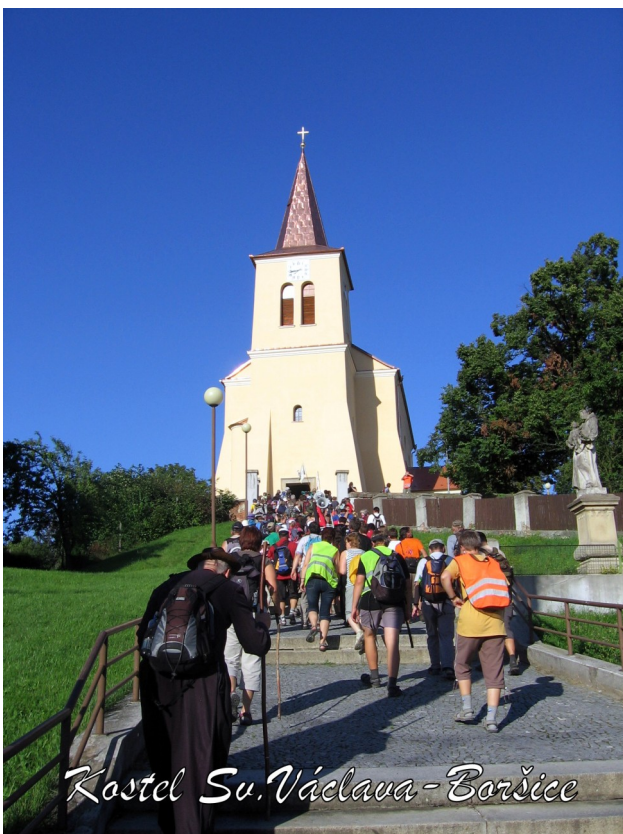
Kostel Sv. Václava - Boršice