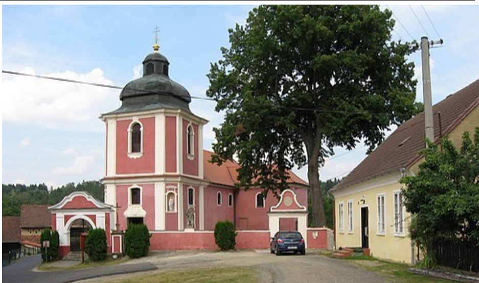
Poutní kostel Navštívení Panny Marie v Hrádku u Vlašimi