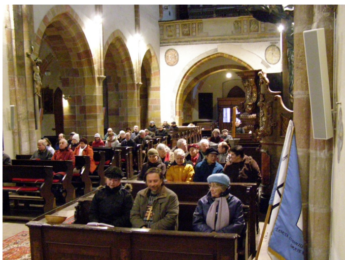
4. etapa—při mši sv. v Nymburce