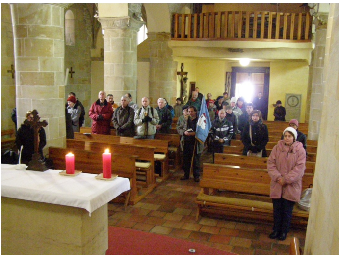
Zahájení II. etapy