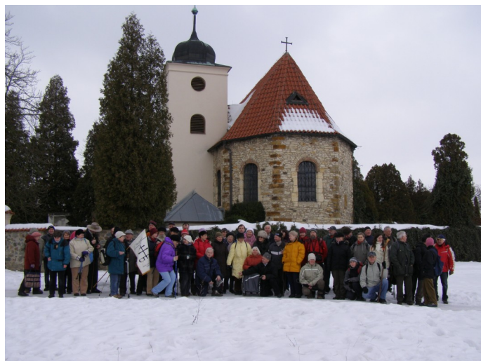
Vykročení na XXIX. ročník CMP