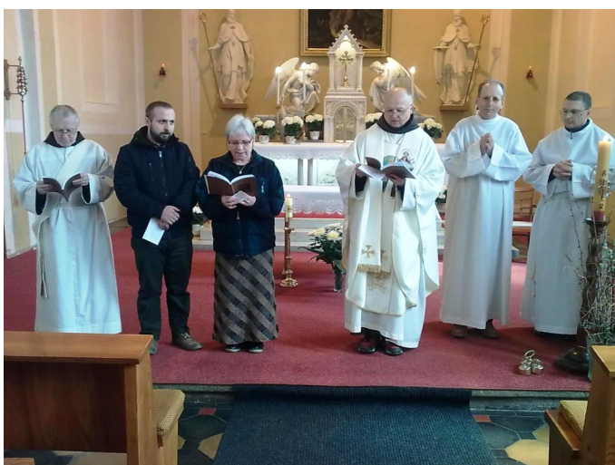
Foto: obřad obnovy trvalé profese