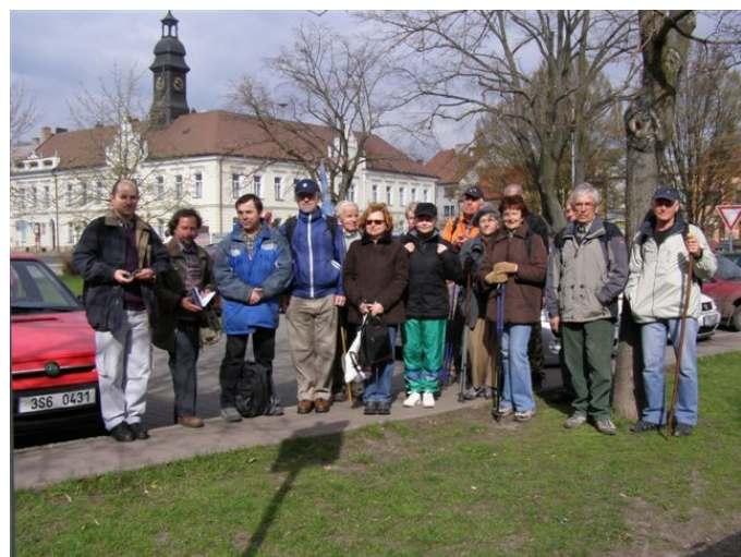
Na startu 5. etapy—Městec Králové