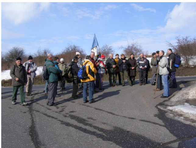
Modlitba Anděl Páně