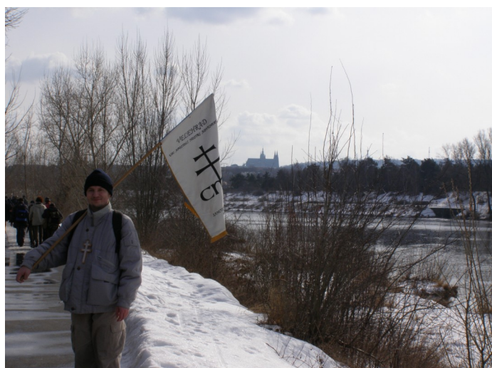
Po vltavském břehu