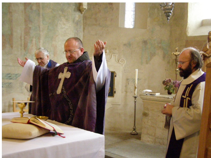
mše sv. na Levém Hradci