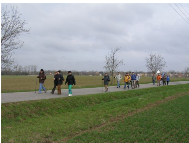
5. etapa—modlitba růžence po pěticích