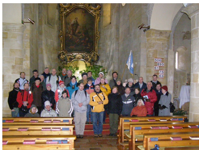
V cíli I. etapy na Proseku u sv. Václava