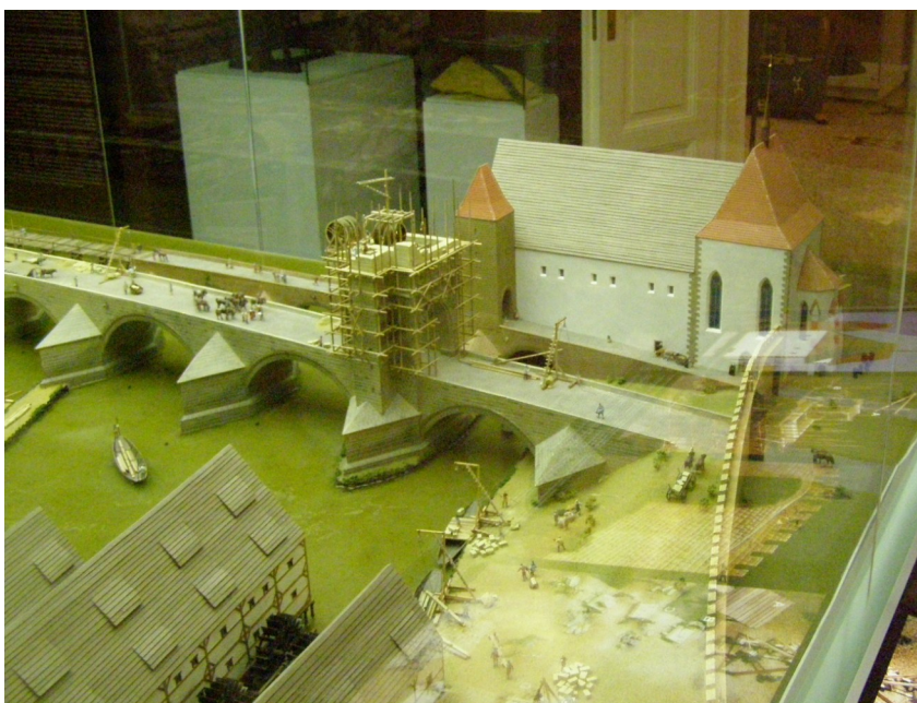
Křižovnický klášter u Juditina, později Karlova mostu

dařilo se všem dobře. neočekávaně teprve 22. 9. 1253, tedy smrti sv. Matky Kláry Anežčin synovec miloval svou tetu a dobrodiní. Ačkoliv ve své politice ovlivňoval vlivu své druhé ty Štaufské, přesto jí důvěru a r. 1277 jí Kunhutu, která se v Anežčině klášteře. Zajímavé je i setkání s její bývalou Babenberskou, která Přemysla Otakara II. r. 1255. manželem Jindři-