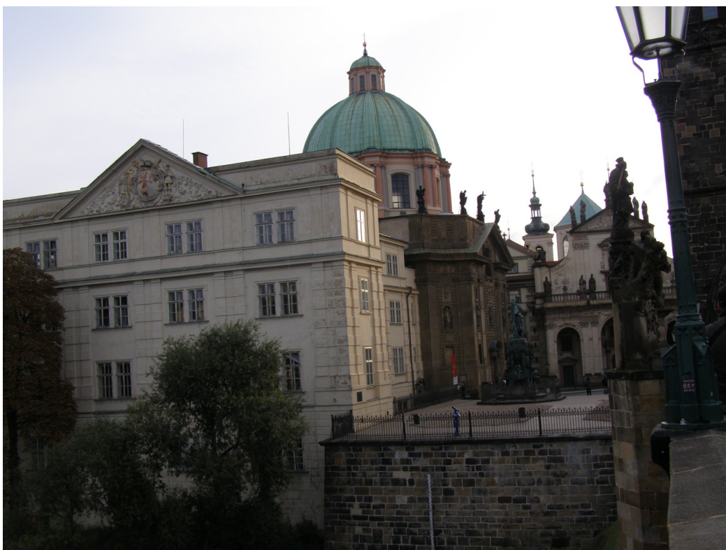
Opět křížovnický klášter, tentokrát v současné podobě

Na závěr se s Vámi loučím slovy sv. Matky Kláry, které napsala sv. Anežce České ve svém 2.