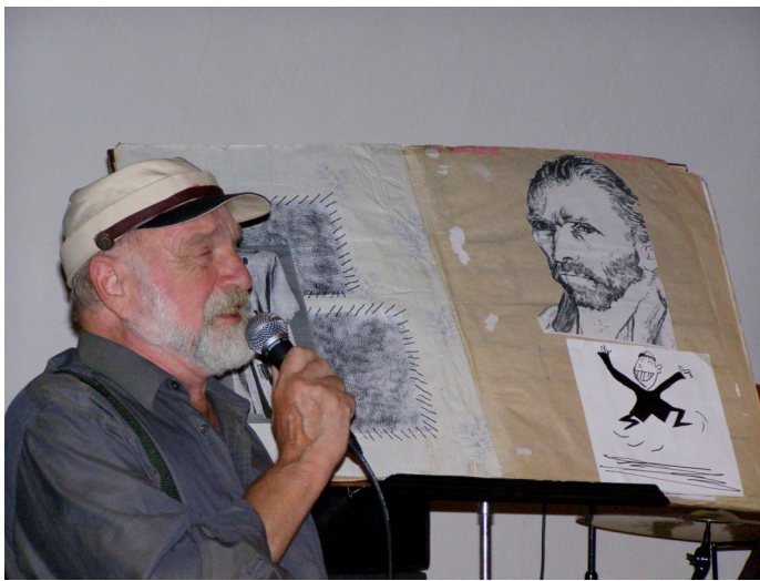
Zpívám baladu o sv. Františkovi z Assisi