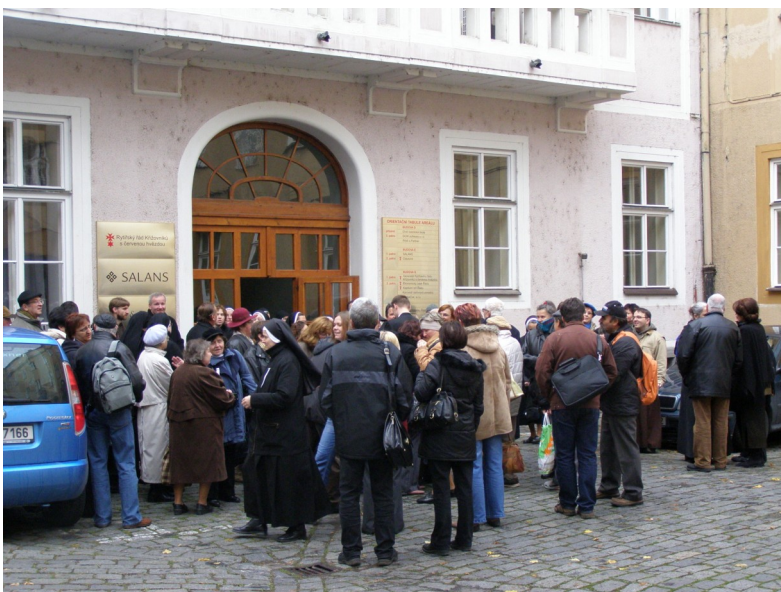
Účastníci se schází na nádvoří křižovnického kláštera

Tato svoboda je ještě jednou ohrožena nabídkou sňatku ze strany ovdovělého císaře Bedřicha II. Je to velké pokušení - Anežka by měla okamžitě k dispozici moc a prostředky k uskutečnění svého rozsáhlého sociálního