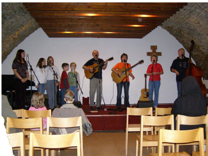
Zpívá a hraje Ztracená kapela