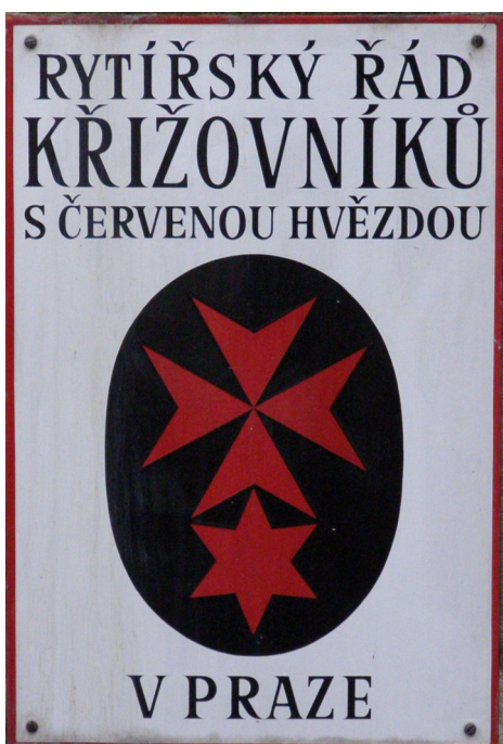
Dílo sv. Anežky po 776 letech.