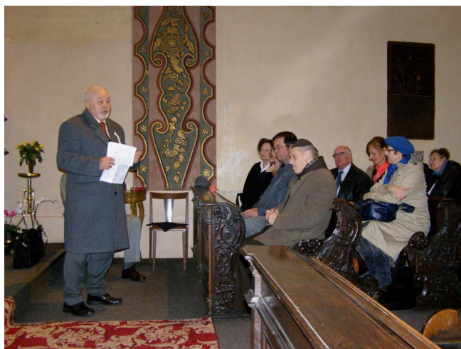
Zakončení konference se uskutečnilo v kapli u minoritů od sv. Jakuba na Starém Městě.

Klaníme se ti, Pane Ježíši Kriste, tady i ve všech tvých kostelích na celém světě a chválíme tě, protože svým Svatým Křížem jsi vykoupil svět.