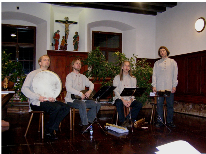
Estonští hudebníci a zpěváci