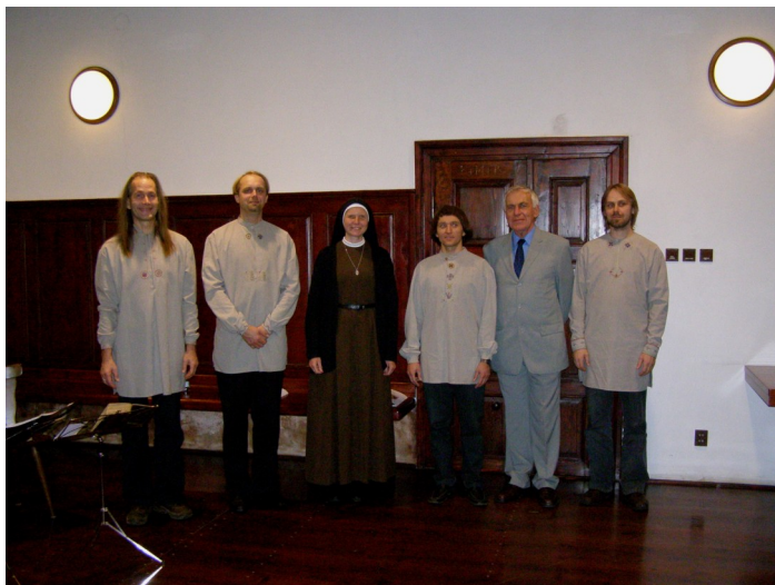
Konec koncertu – dobrou noc