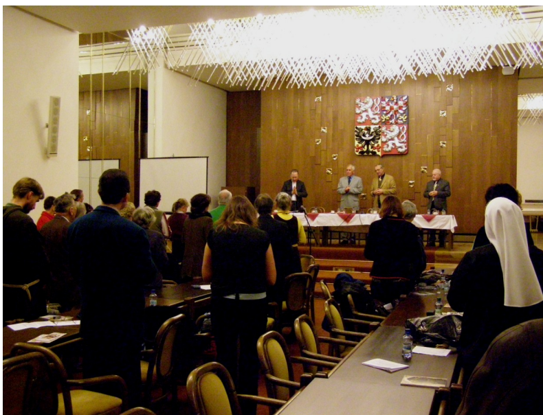
Modlitba na konci zasedání

A teď nám Anežka ukázala, že i když jsme františkáni ze světa, nemusíme být tak smrtelně rozumní, rozvážní a chladně uvažující, protože naše charisma přece není být