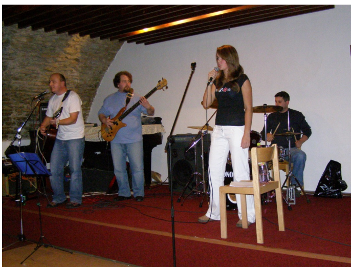
Rocková skupina Českéj chleba